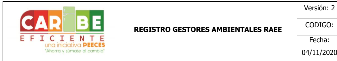
Tabla 1 Formato de presentación de gestores ambientales.